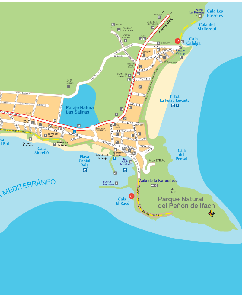
TABLE DES ECO-ROUTES EN FAMILLE DE CALP